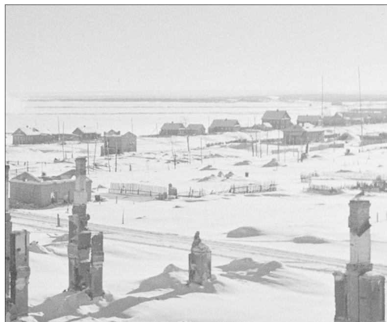
Фото из архива музея Вознесенской школы № 7